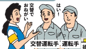
交替運転者の配置