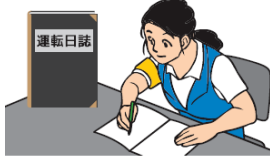
運転日誌の備付け