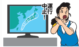
異常気象時等の措置