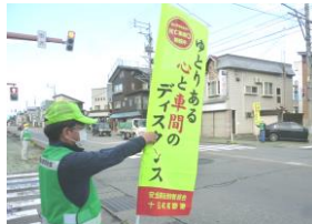
交差点街頭広報 (32箇所 100名) 9/27