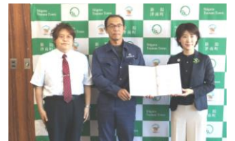
「安全運転署名簿」提出 6班(津南町) 9/21

※次回の交差点街頭広報は…10/21、11/4(朝 7:10~8:10)です！班長さんから要請がありましたら、緑帽子・ベスト着用、のぼり旗持参をお願いします。