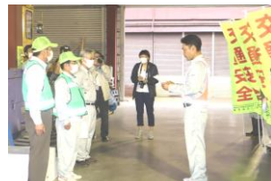
実践運動出発式 (松蔵建設) 10/1