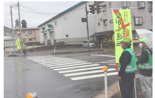
↑ 交差点街頭広報活動