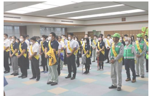
↑ J A十日町 交通安全広報活動 ↓