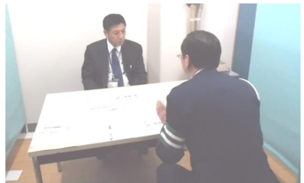
十日町農業協同組合 中条支店