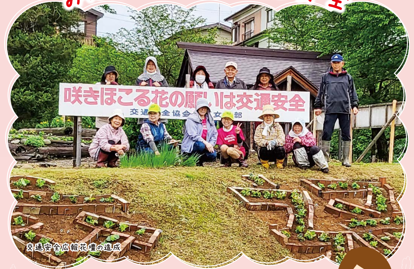
交通安全広報花壇の造成